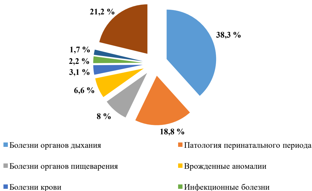
Рисунок 3.2-1 Структура заболеваемости детей 1 года жизни на территории Архангельской области за 2019-2021 гг., %

Средняя частота заболеваемости по всем болезням детей первого года жизни в Архангельской области за 2019-2021 гг. составила 2 902,0 ‰ и снизилась за изучаемый период на 13,7 %. Снижение уровня заболеваемости отмечено по всем классам болезней; наибольшее по классам «Болезни органов дыхания» (на 23,8 %) и «Врожденные аномалии» (на 12,9 %) (табл. 3.2-20).