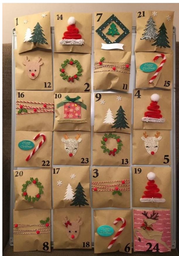
Рисунок 3 – Адвент-календарь (2 вариант)