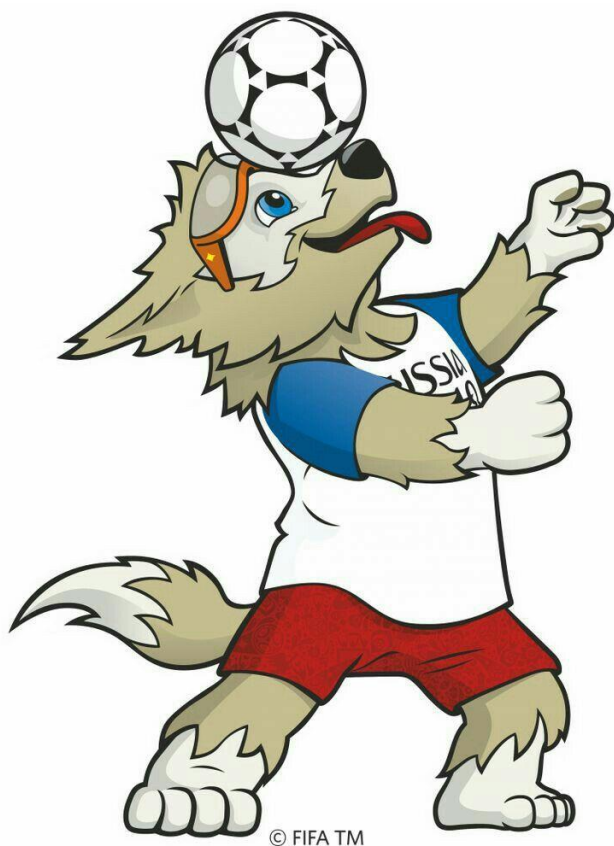
Рисунок 1 – Маскот Чемпионата мира по футболу 2018 – Забивака

- Для номинации I – « Легенда Севера » (маскот):