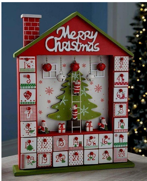
Рисунок 2 – Адвент-календарь (1 вариант)

- Для номинации II – « По следам дикого северного оленя »